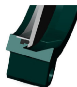
Уплотнение с эластомером