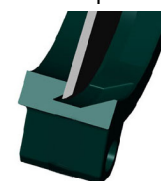
Уплотнение Металл / металл