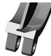
Уплотнение металл / металл