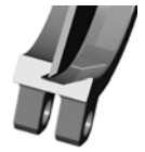
Уплотнение Металл / металл