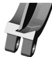
Уплотнение металл / металл