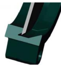
Уплотнение металл / металл